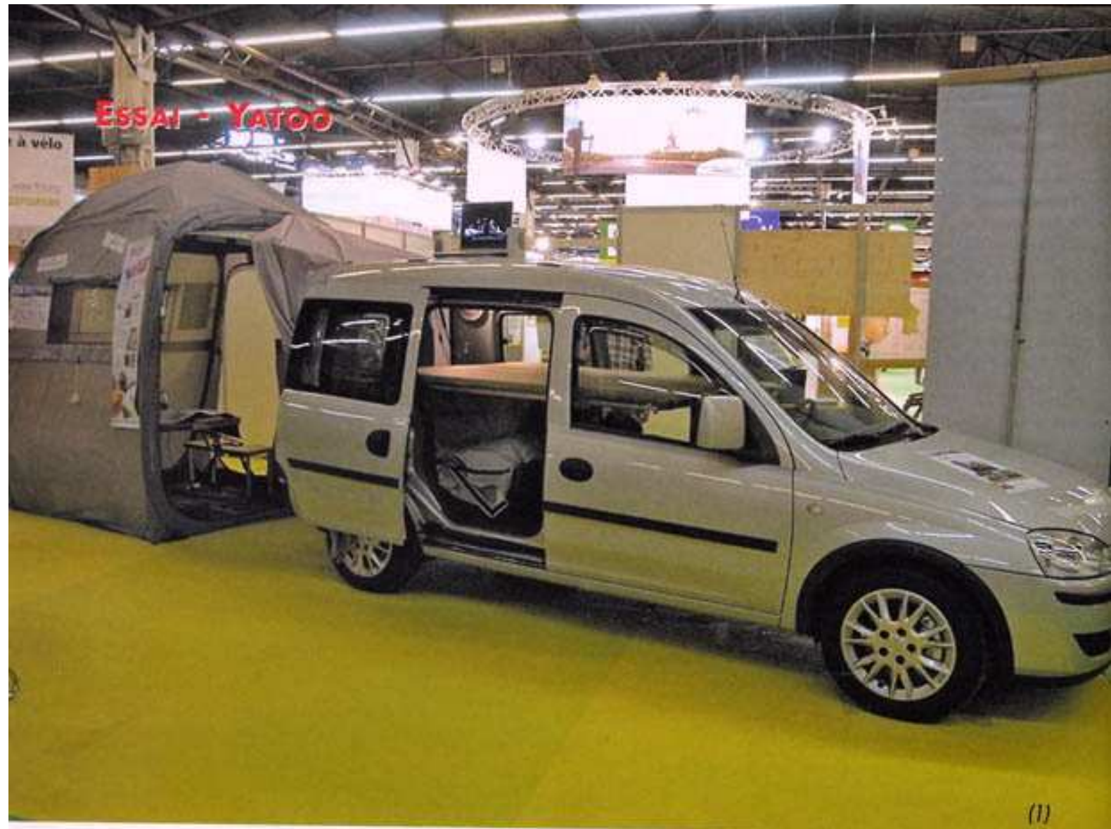
(1) Vue de l'ensemble véhicule, Tipoo, sans la chambre, une partie du sas est relevée. Dans la voiture, le Lidoo est installé.