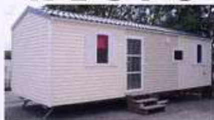
RAPIDHOME REL 81, neuf 2008, 25.8m², 15.800 €