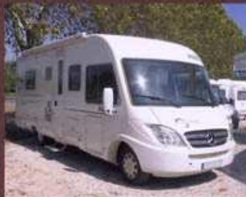
PILOTE EXPLORATEUR 6733, 2008, 3 316km, 318 CDI 2.2L, 72.550 €