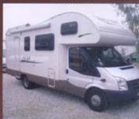
VILAMOBIL ATHENIA 381, 2007, 20 800km, Ford TDCi, 38.000 €