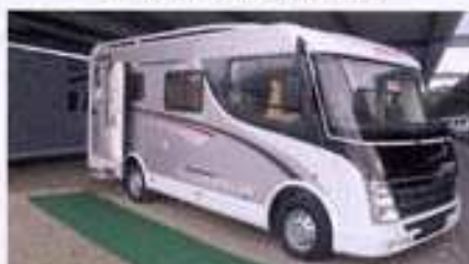
DETHLEFFS GLOBEBUS IS, neuf 2010, Fiat 2.3L, 54.670 €