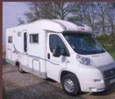
ADRIA CORAL 650 SP, 2007, 19 900km, Fiat Ducato 2.3L, 37.800 €