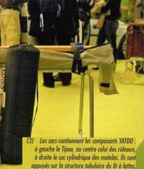
(3) Les sacs contiennent les composants YATOO : à gauche le Tipoo, au centre celui des rideaux, à droite le sac cylindrique des matelas. Ils sont appuyés sur la structure tubulaire du lit à lattes.

rieur de la tente, pour la nuit, il est possible d'ajouter une chambre (en option) pour deux adultes ou trois enfants.