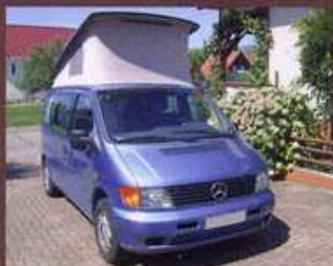
WESTFALIA MARCO POLO MB, 1997, 106 000km, porte-vélos, 23.000 €