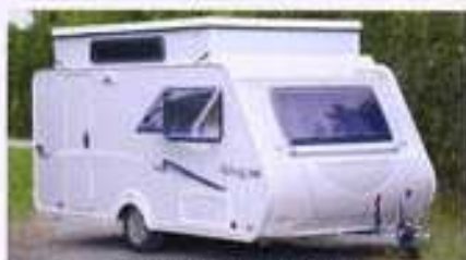
TRIGANO SILVER 340 DD, neuf 2009, 3Places, 13.509 €